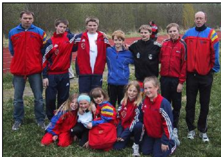
Deltagere på Ranheimstafetten. 2004.

Pga liten aktivitet så er det foreslått at trimgruppa innlemmes i allidretten.