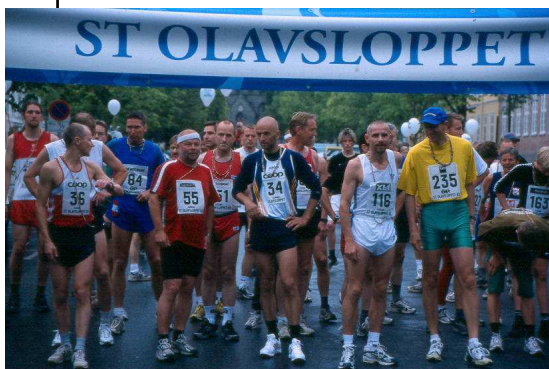
Da Stadsbygd ledet St.Olavsløppet.