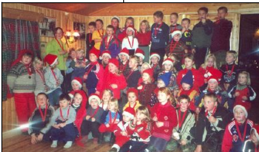
Deltagere på Nissemarsjen 2000 i Granlund.

Juleavslutning oppi Granlund med nisse marsj. Røde luer og lommelykt må man ha da. Dette er fordi vi er ute i å leiter etter reflekser som lyser i mørket. Kanskje vi treffer flere som er ute å lusker før jul.