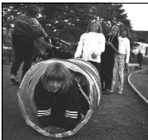
Barneidretten i aktivitet på "Plassen"