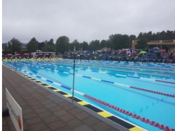
Svømmebassenget i Borås

Årets sesong er over og det har vært to konkurranser i løpet av de to siste ukene.