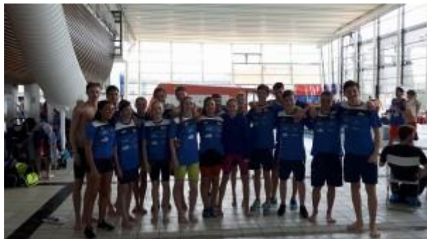
Deltakerne på Marinlyst open 2016