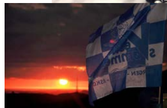
Natt-tur fra Ulrikken til Fløyen