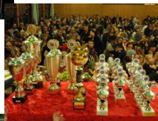
Utdeling av pokaler og priser på årlig juleavslutning