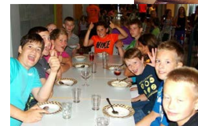
Oppstartsleir i Volda 2013