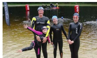
Bergen Open Water

Vi tilbyr diverse svømmekurs for nybegynnere. Etter fullført Crawlteknikk-kurs får en tilbud om å hospitere i Pirayagruppen. Dette for å se om aktiv svømmetrening er gøy.