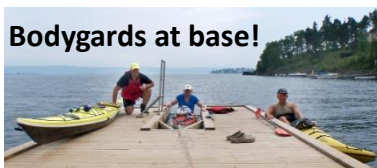
Bodygards at base!

Steinar sjekket badetemp'n til 21 grader ← NDK detaljer gjennomgås nøye! Alle var enige at det hadde vært en flott tur og at ferske "kajakk-brød" og tapas var en sikker vinner for fremtidige turer !