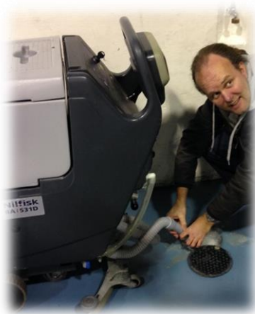
Figure 9 Tømme avfallsvann i sluk i gulved