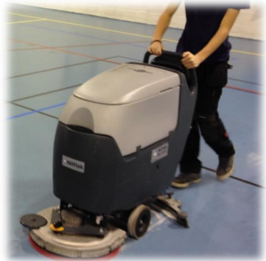
Figure 1 Vaskemaskin