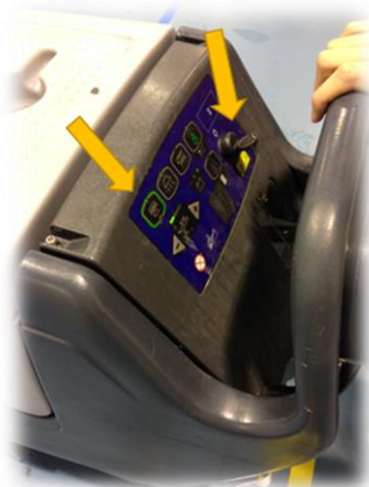
Figure 5 Dashboard