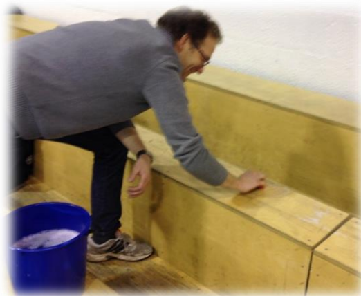
Figure 3 Benkeslitern