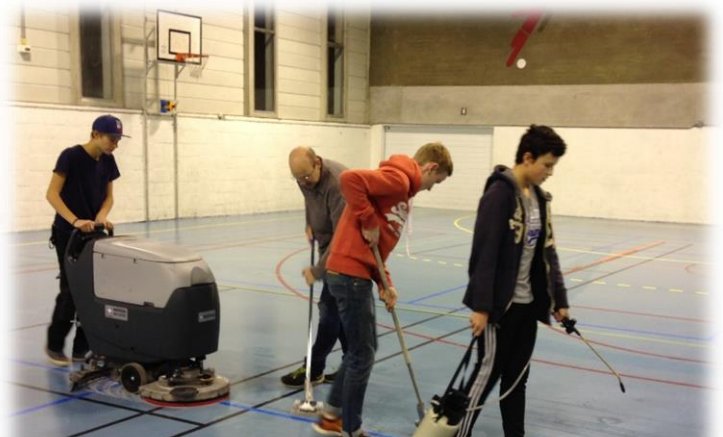
Figure 2 Én sprøyter på såpe, to skraper løs klister-flekker, én kjører vaskemaskin (én vasker benk osv)

Tips: Ligg gjerne 1-2 runder «i forkant» med sprøytingen slik at vaskemiddelet får tid til å løse opp klisteret før maskinen kjører over og tørker opp. Dermed får maskinen med mer av klisteret, uten behov for å kjøre to runder.