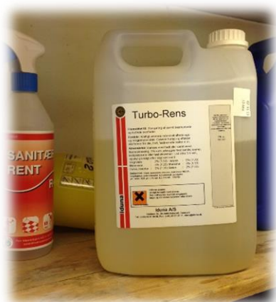
Figure 4 - Såpe til vaskemaskin og benkevask